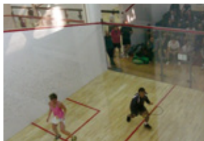
Lublin - CUBE Squash&Fitness - 6 kortów