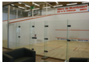
Szczecin SquashZoneClub - 4 korty