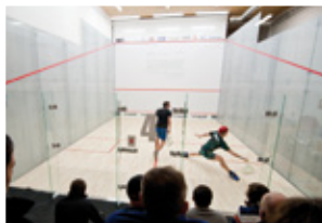
Gdańsk FITNESS AUTHORITY - 5 kortów

Dołącz do inwestorów, którzy nam zaufali: w ciągu ostatnich lat zbudowaliśmy w Polsce 80 kortów McWIL: